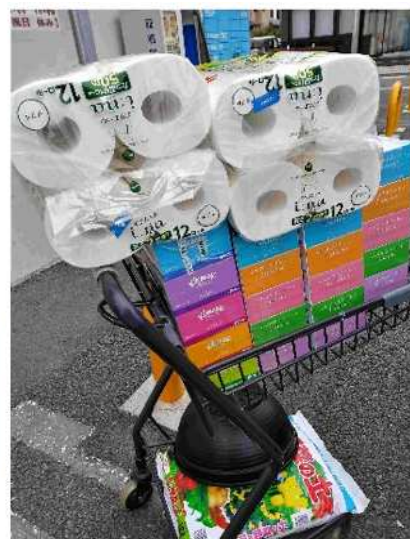
活動の様子② (買い物支援)